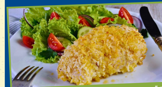
FILÉ DE FRANGO COM CROSTA DE PARMESÃO